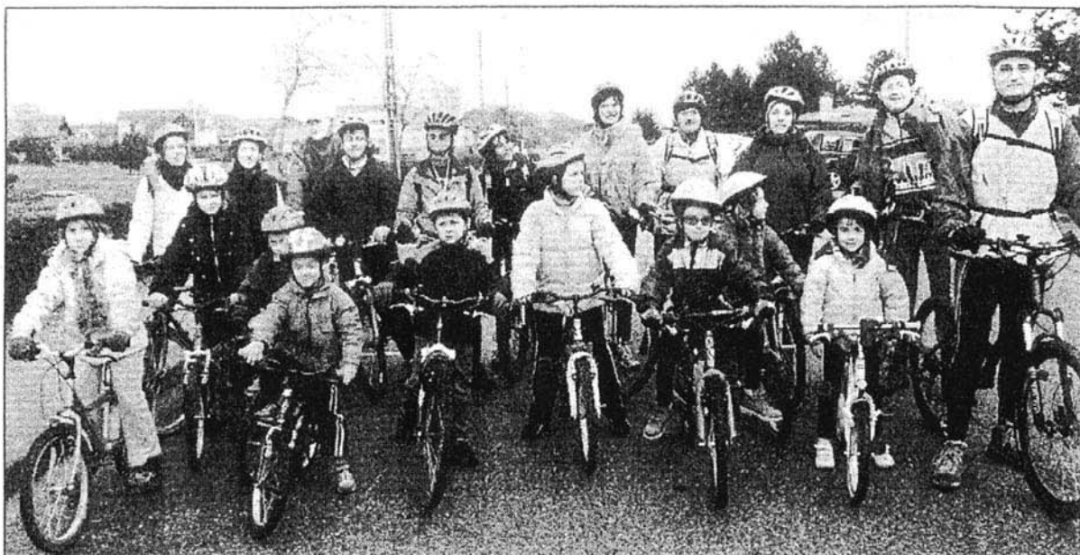
Départ des plus jeunes encadrés par Ludres Evasion.

Hier à la Sapinière, se déroulait la douzième randonnée de « Par Monts et par Jardins ». Une manifestation qui a permis à chacun selon sa motivation et son degré de sportivité de s'engager à pied ou à vélo sur des circuits plus ou moins longs.